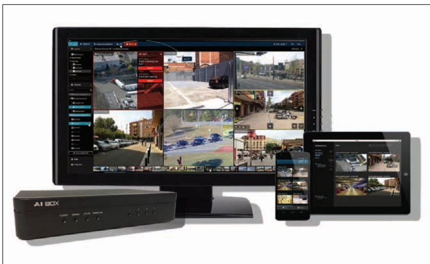
L'I.C. Piersanti Mattarella di Roma si è dotato di un sistema di videosorveglianza firmato GANZ CORTROL e installato da MIB TECH Srl

La soluzione adottata si basa sulla fornitura di telecamere IP e modulo AI-BOX, il tutto centralizzato su piattaforma di gestione software GANZ CORTROL. Ad allarme scattato, l'operatore in sala di controllo SELPOL attiva la procedura, che garantisce: consapevolezza dell'intrusione da parte di estranei in orario notturno; attivazione di messaggio vocale tramite tromba audio IP per dissuadere gli intrusi; segnalazione immediata alla pattuglia e alle forze dell'ordine e pronto intervento con ispezione da parte dei carabinieri finalizzato al fermo degli intrusi. L'architettura del progetto realizzato è basata su piattaforma client-server. Sono state fornite unità server NVR dislocate in