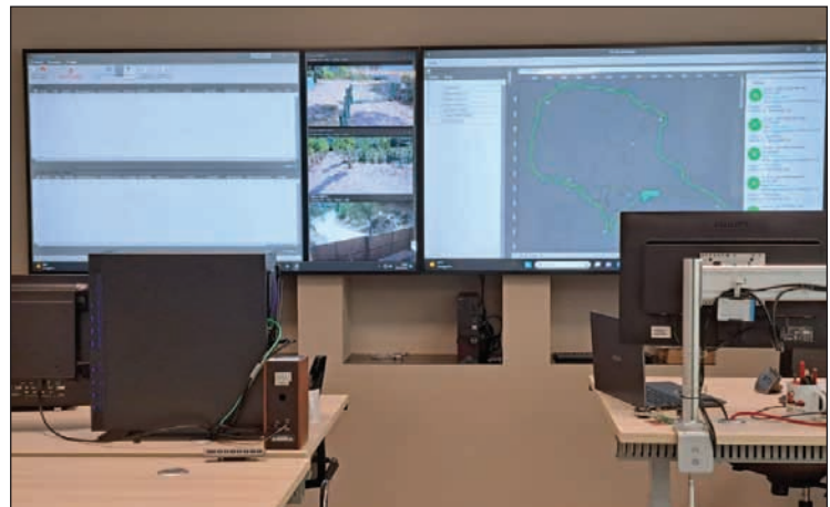
Rappresentazione della control room tecnica allestita da Elmar per il monitoraggio e la telegestione del sito in oggetto