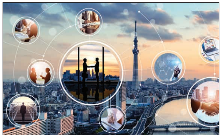
La soluzione favorisce la flessibilità e le future espansioni o integrazioni